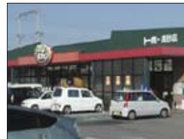
スーパートーホー