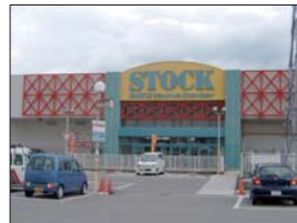
ホームセンターストック