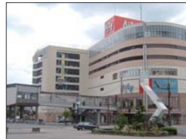
アイティショッピングモール